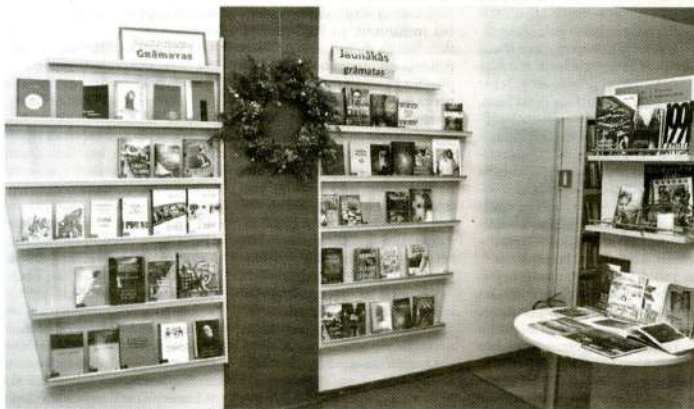
JAUNĀKO GRĀMATU izstādes bibliotēkās rīko regulāri.