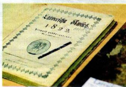
Pirms 200 gadiem, 1822. gada 5. janvārī, Jelgavā iznāca pirmā regulārā laikraksta latviešu valodā pirmais numurs. "Latviešu Avīzes" turpināja iznākt līdz 1915. gadam.